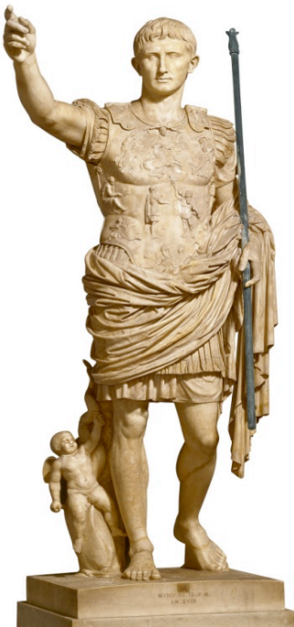
Fig.1 Puntuación máxima. 2 puntos

Analiza y comenta las dos obras de arte presentadas: