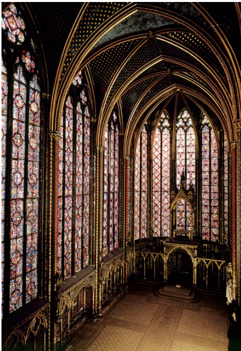
Fig.1 Puntuación máxima. 2 puntos

Analiza y comenta las dos obras de arte presentadas: