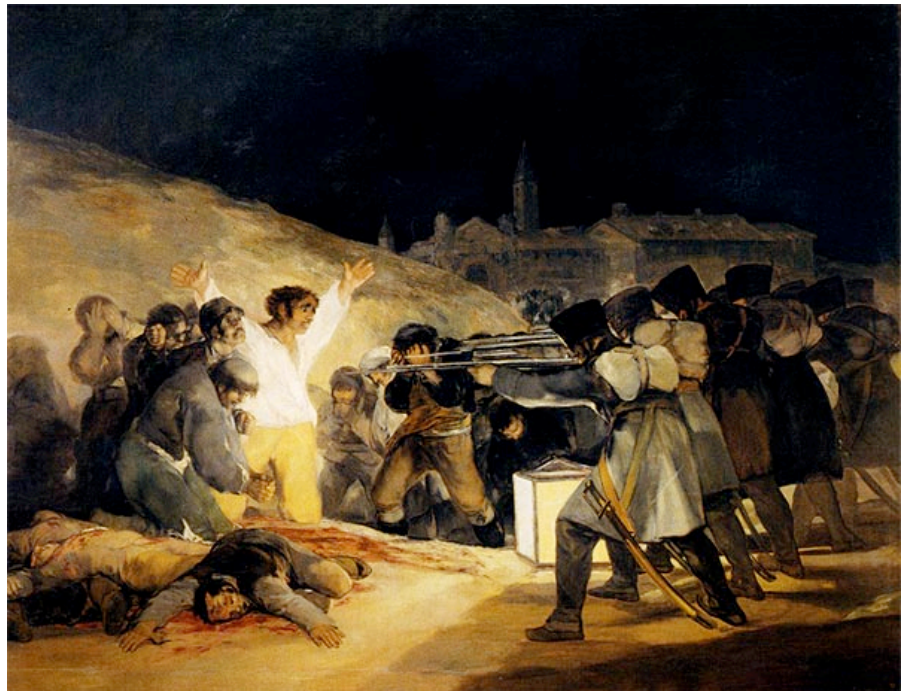
Fig.2 Puntuación máxima. 2 puntos